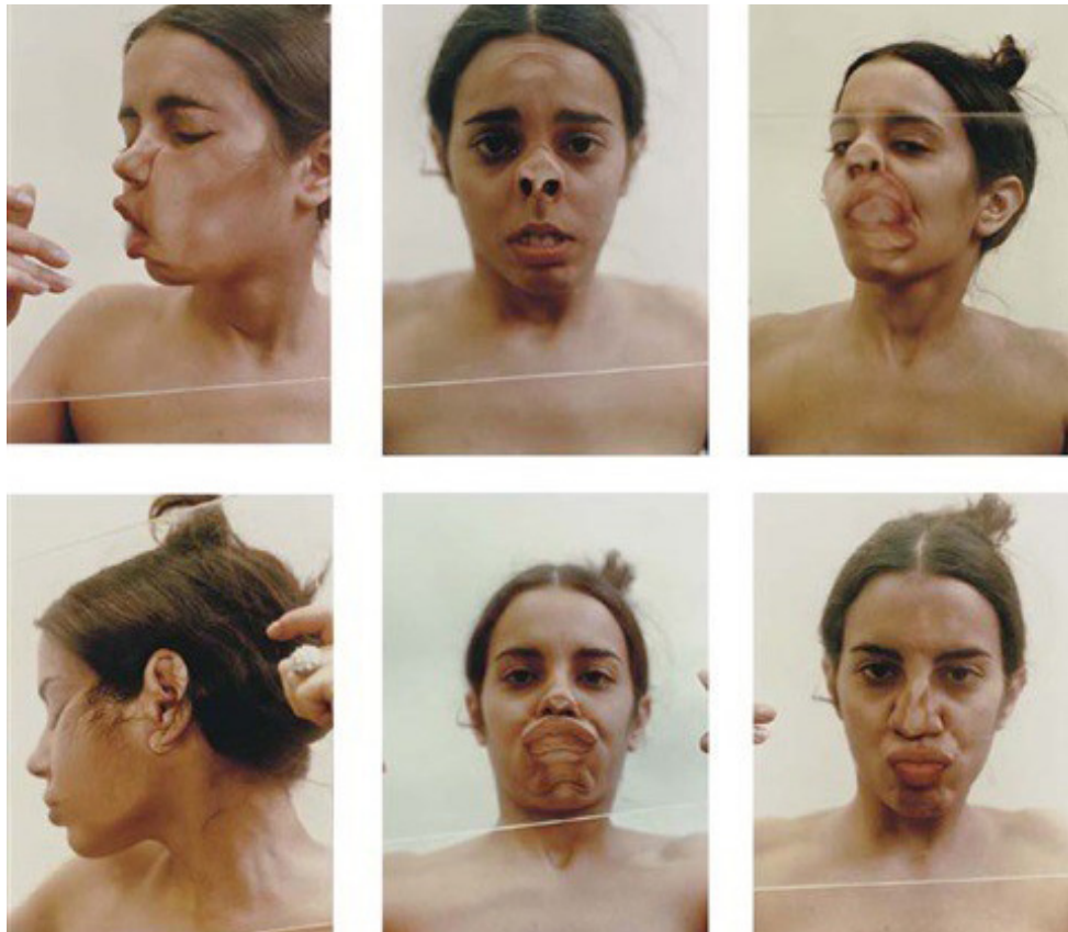
Ana Mendieta (American/Cuban, 1948–1985) Untitled (6 works, from the Glass on Body Imprints) Medium: color photographs

En esta fase que he nombrado como primera fase del extrañamiento cabría describir la percepción de uno mismo y el conocimiento de sí. Ya desde los griegos y los romanos existe una preocupación del cuidado de sí, ocuparse de sí, conocerse a sí mismo, formarse y llegar así a lograr la libertad individual. Vemos que en la ética como la práctica reflexiva de libertad gira en torno al “cuida de ti mismo” y uno no puede cuidar de sí mismo sin conocerse 6 .