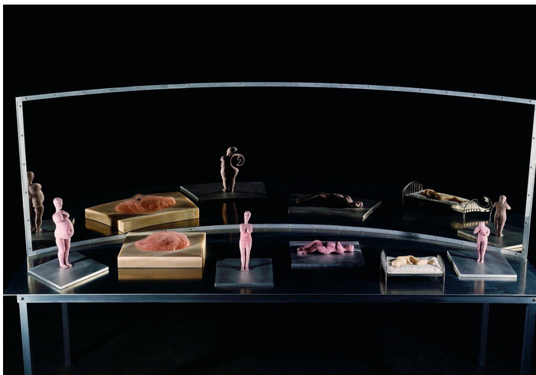
Il Était Réticent, mais Je l'ai Révélé (Él era reticente, pero lo revelé), 2003 Tela, mármol, acero inoxidable y aluminio: seis elementos 182.9 x 284.5 x 91.4 cm

Para Artistas como Louise Bourgeois la maternidad ha sido tema importante en su trayectoria tanto en su reflexión como cuerpo embarazado como en el vínculo madre-hijo utilizando gran cantidad de materiales plásticos como el dibujo, la tela, el acero. Sus arañas son símbolo de la maternidad.